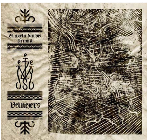
11.attēls. „Velnezers” – „Es uzcēlu durvis tīrumā” Figure 11 „Velnezers” – „Es uzcēlu durvis tīrumā”

stariem aizpilda visu ainavu, savukārt albuma „Es uzcēlu durvis tīrumā” vākā stari caurvij koka zarus vai arī saknes. Katrā gadījumā ir jūtama tautisko tradīciju piesaiste, nacionālais kolorīts, ko jo sevišķi pastiprina ornamentālo līniju un ormanentu izmantojums, kā arī vecās drukas savienojums ar mūsdienu garajiem patskaņiem, veidojot pseidotautsiku izpausmi, toties daudz saprotamāku cilvēkam, kurš pilnībā nezina veco druku. Sevišķi var izcelt grūti atšifrējamo, bet oriģinālo burtu savirknējumu zīmējuma vidū, ko var uztvert kā grupas tautisko logo „Velnezers”. Ņemot vērā milzīgo albumu klāstu pasaulē, šie ir vieni no oriģinālākajiem noformējumiem, kas ir spējīgi piesaistīt klausītāju uzmanību.