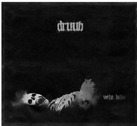
3.attēls. „Druun” – „Veļu laiks” Figure 3 „Druun” – „Veļu laiks”