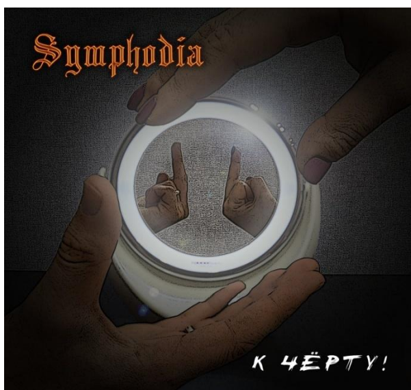
5.attēls. „Sanctimony” – „Demons Ahead” Figure 5 „Sanctimony” – „Demons Ahead”

(Skyforger, 1998) albumu vizualizēja ar gleznotāja Voldemāra Vimbas darbu „Kauja pie Saules, 1236”.