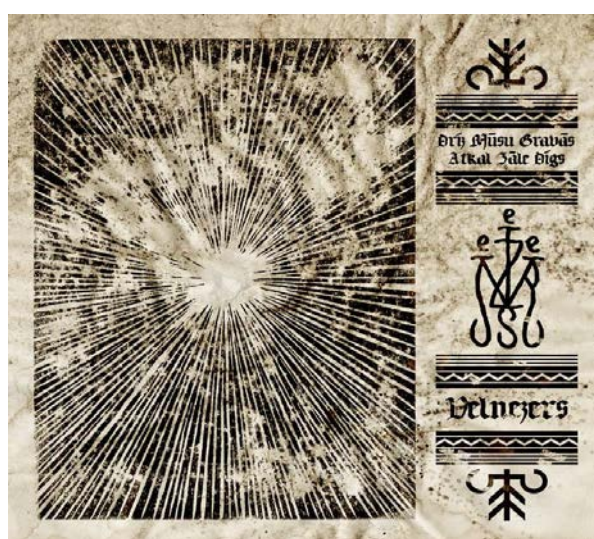
12.attēls. „Velnezers” – „Drīz mūsu gravās atkal zāle dīgs” Figure 12 „Velnezers” – „Drīz mūsu gravās atkal zāle dīgs”