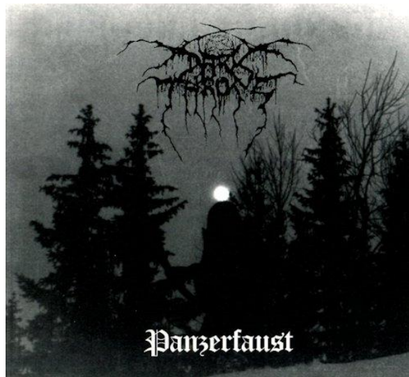
2.attēls. „Darkthrone” – „Panzerfaust” Figure 2 „Darkthrone” – „Panzerfaust”

Šāda veida noformējums ir salīdzināms ar 90. gadu skandināvu black metal (tā kā vairāki apakšžanru nosaukumi ir grūti tulkojami latviešu valodā, vai arī to tulkojumi ir neveikli, stilu apzīmējumi ir atstāti angļu valodā) grupu („Darkthrone”, „Carpathian Forest”, „Burzum” u.c.) albumu vāciņiem,