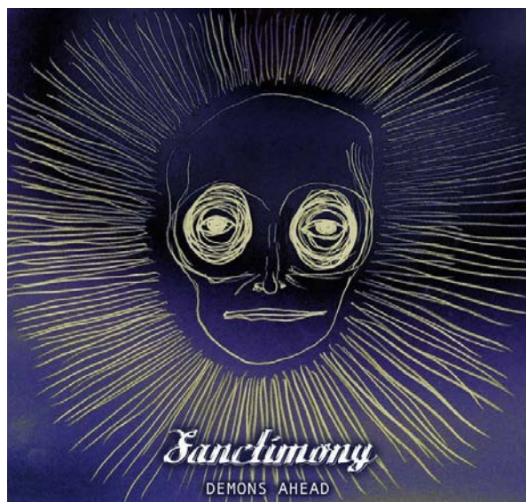
6.attēls. „Symphodia” – „K čortu” Figure 6 „Symphodia” – „K čortu”

Grupa „Sanctimony” 2019. gadā atzīmēja 25 gadu pastāvēšanas jubileju, par godu tam grupa laida klajā singlu, kas satur vienu jaunu dziesmu Demons Ahead ‘Dēmoni, uz priekšu!’ Vāciņš satur gadiem ilgo un tipisko grupas nosaukuma logo, savukārt singla nosaukums ir zem grupas logo ar mazāka izmēra burtiem, arī centrēts. Pats attēls, kas idejiski ataino dēmonu, ir diezgan pamanāms, jo acis un acu loki ir ļoti izteikti, galvu aptverošais staru aplis asociējas ar galvas rotu, kādas izmantoja dažādas ciltis Āfrikā, tādējādi tikai pastiprinot šo dēmonisko sajūtu. To pastiprina metālmūzikas vāciņiem diezgan neraksturīgais zilgans fons, kas, autoraprāt, padara šo noformējumu pamanāmu uz citu albumu fona.