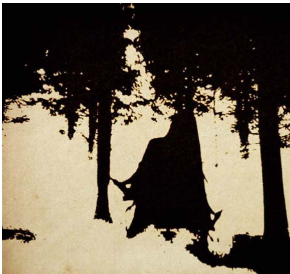
1.attēls. „Druun” – „Demo” Figure 1 „Druun” – „Demo”

Noformējumu raksturojums tiek sākts ar nozīmības ziņā necilāko ierakstu, kas parasti tiek izmantots kā grupas mēģinājums iepazīstināt ar savu daiļradi. Tas ir demo ieraksts, ko veikusi grupa „Druun”, kas ierakstu arī nosaukusi „Demo”.