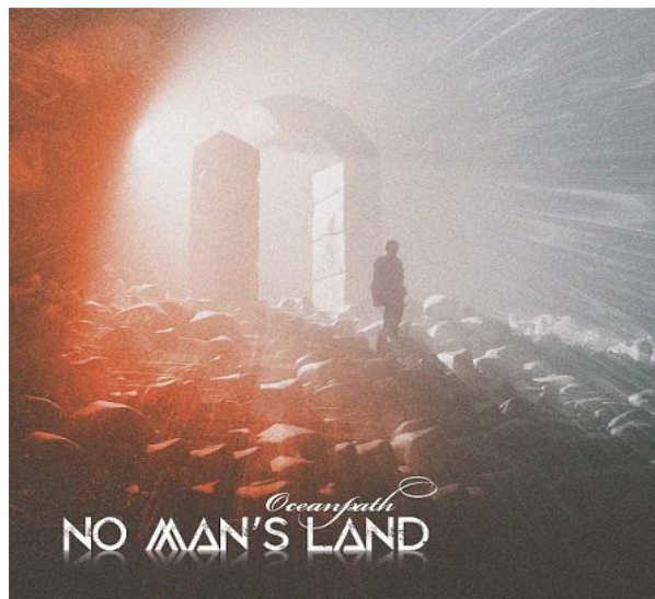
10.attēls. „Oceanpath” – „No Man's Land” Figure 10 „Oceanpath” – „No Man's Land”