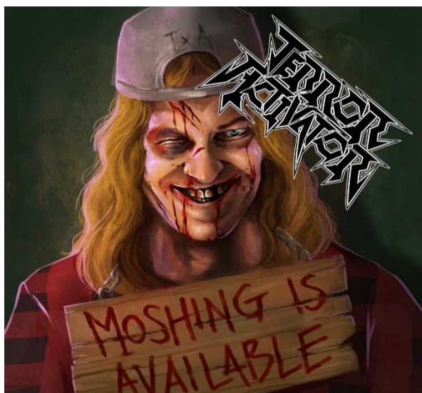
7.attēls. „ Terror Activator ” – „ Moshing Is Available ” Figure 7 „ Terror Activator ” – „ Moshing Is Available ”

(Bunker, 132) un kara laikā iekļāvās bunkuru rindā, kas veidoja robežu ar citām Rietumeiropas valstīm, šajā gadījumā Beļģiju. Dziesmu tekstu trūkums liedz iespēju pārliecināties par saistību ar vēsturi, tomēr dziesmu nosaukumi, piemēram, Shadow Zone ‘Ēnu zona’, Dark Water ‘Tumšais ūdens’, Cyanide Tears ‘Cianīda asaras’ u.c. ļauj iedomāties kara vai arī citu briesmu lietu apdziedāšanu.