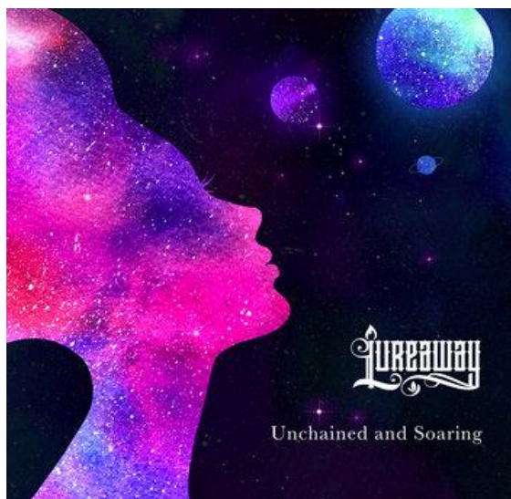
9.attēls. „Lureaway” – „Unchained And Soaring” Figure 9 „Lureaway” – „Unchained And Soaring”