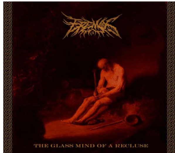
4.attēls. „Eremos” – „The Glass Mind Of Recluse” Figure 4 „Eremos” – „The Glass Mind Of Recluse”