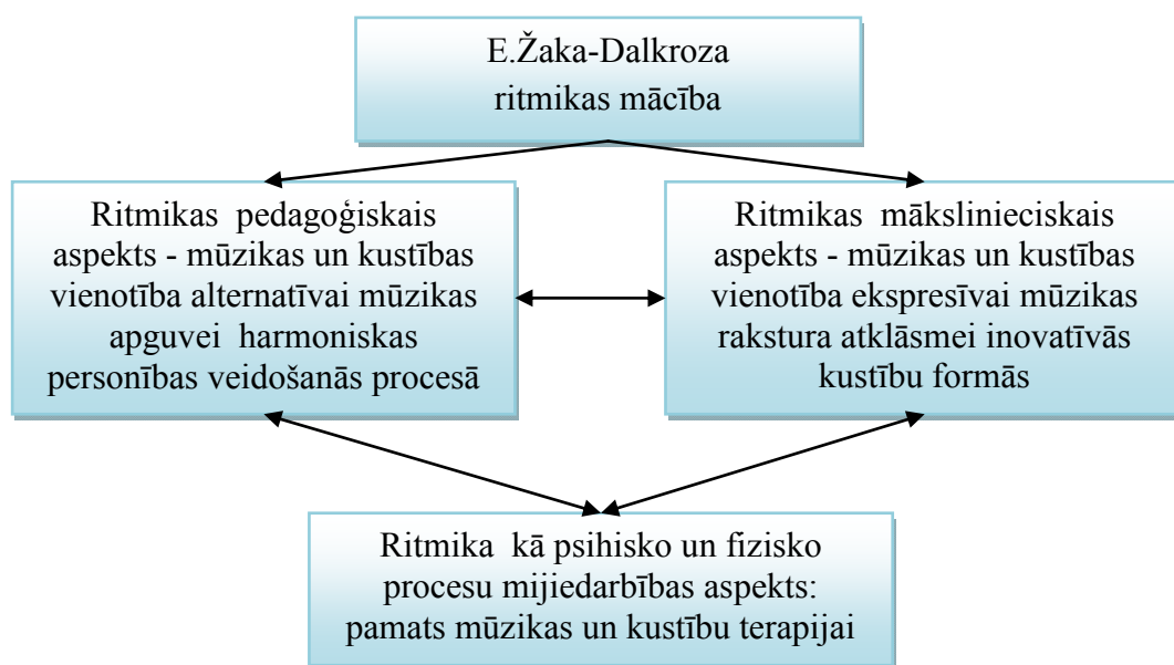
1.attēls. E.Žaka-Dalkroza ritmikas mācības attīstība

Ritmikas mācības pedagoģiskie, mākslinieciskie, tāpat arī psihisko un fizisko procesu mijiedarbības aspekti savstarpēji integrējas un viens otru neizslēdz arī katra atsevišķa aspekta robežās. Skat.1.attēlu.