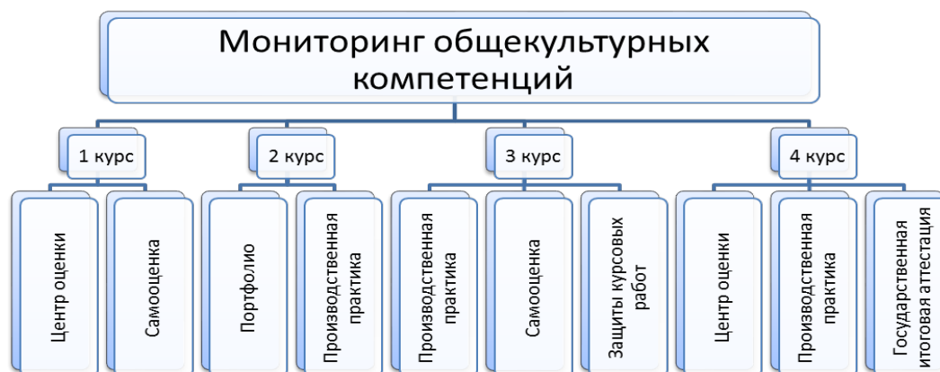
Рисунок 1. Модель мониторинга общекультурных компетенций Figure 1 The model of monitoring universal competences

Авторами предложена модель мониторинга сформированности компетенций студентов в течение всего периода обучения (рисунок 1).