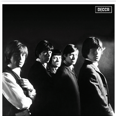
5. attēls. Grupas „The Rolling Stones” albums „The Rolling Stones” (1964) Figure 5: The Rolling Stones – “The Rolling Stones” (1964)

Līdzīgi rīkojusies grupa „Borowa MC” (sk. 6.attēlu), kas, izmantojot fotogrāfiju kolāžu, no vienas puses, parāda, ka ir meklējumos, sava ceļa izvēles priekšā, no otras – norāda uz savu tēlu vismaz daļēju atpazīstamību.