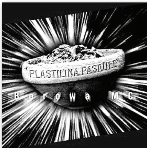
1. attēls. Grupas „Borowa MC” albums „Plastilina pasaule” (2007) Figure 1: Borowa MC – “Plasticine World” (2007)

raksturīgo, cerību tikt pamanītam arī nav daudz. Protams, nedrīkst aizmirst arī pašu muzikantu izvirzīto mērķi, vienam tas varbūt ir mēģināt atrast kaut ko oriģinālu, tieši šeit visvairāk arī var izpausties globalizācija jeb lokālo elementu izmantojums masu produktā, citam mērķis ir vienkārši spēlēt kvalitatīvi un iekarot savu vietu starp līdzīgajiem, vēl citam tas ir vienkārši hobijs, kas līdzīgi kā loterijā var kādreiz pārvērsties par laimes numuru un izraušanos Latvijas vai pat pasaules mūzikas tirgū.