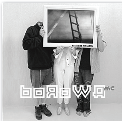
6. attēls. Grupas „Borowa MC” albums „Trepis iz nakurīni” (2005) Figure 6: Borowa MC – “Stairway to Nowhere” (2005)

Līdzīgi rīkojusies grupa „Borowa MC” (sk. 6.attēlu), kas, izmantojot fotogrāfiju kolāžu, no vienas puses, parāda, ka ir meklējumos, sava ceļa izvēles priekšā, no otras – norāda uz savu tēlu vismaz daļēju atpazīstamību.