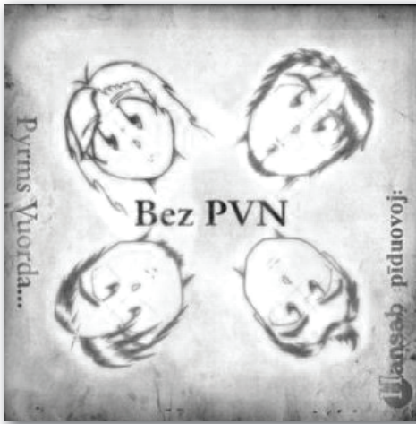
3. attēls. Grupas „Bez PVN” albums „Pyrms Vuorda...” (2007)

Otrkārt, pasaules mūzikā ir daudz piemēru, kad īpaši debijas albumā parādās grupas foto, lai veicinātu atpazīstamību, radītu priekšstatu. Latgaliešu grupas, varbūt apzinoties, Latgales, Latvijas mazos apmērus, saglabā zināmu noslēpumainību, intrigu, piemēram, grupa „Bez PVN”. Uz vāciņa ir četru grupas dalībnieku sejas, taču tās visai attālināti iepazīstina ar grupas izpildītājiem, tieši otrādi – tuvina globālajam, Japānas mangu stilam (sk. 3. attēlu).