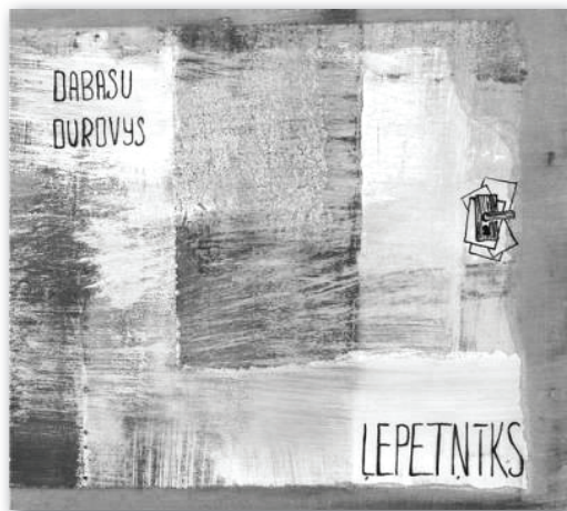
7. attēls. Grupas „Dabasu Durovys” albums „Ļepetnīks” (2008) Figure 7: Dabasu Durovys – “Butterfly” (2008)