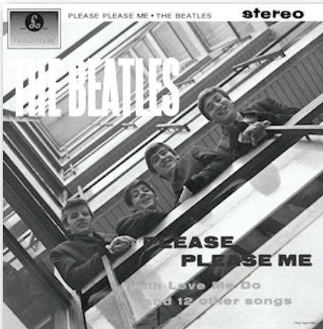
4. attēls. Grupas „The Beatles” albums „Please Please Me” (1963)

Un salīdzinājumam pasaulslaveno grupu „The Beatles” un „The Rolling Stones” debijas plašu apvāki (sk. 4., 5. attēlu).