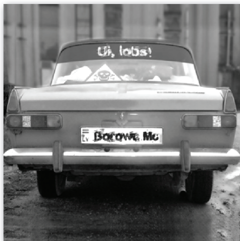
2. attēls. Grupas „Borowa MC” albums „Uī, lobs!” (2008) Figure 2: Borowa MC – “Oh, Great!” (2008)