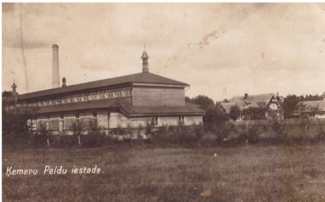
2.attēls. R. Kaļ... vēstule (averss) (Brīvere, 2014., 4.lpp.)

Fotogrāfijas, ģimenes nostāsti, paveiktais, laikabiedru atmiņas paliek, noslēdzoties cilvēka dzīvei. Šai gadījumā fotogrāfija jāsaprot kā dzīves artefakts. Personības autobiogrāfiskajai atmiņai ir daudzšķautņņu struktūra, tā iekļauj pagātnes spilgtu epizožu līmeni, iekšējās loģikas nostiprinātu dzīves gaitas posmu līmeni, kas pieejams kā svarīgas atmiņas par būtisku notikumu, pagātnes kā veseluma pārdzīvojuma līmenis, kas ir unikāls katra cilvēka liktenī. Fotogrāfijas aplūkošana ļauj izprast, kā kultūrā kopumā uztverta dzīve; foto kalpo kā atmiņas regulēšanas līdzeklis, caur to sabiedrība apmierina vajadzību pēc cilvēka eksistences svarīgāko mirkļu pasvītrotāšanas. Vēl 19.gs.otrajā pusē eiropiešu kultūrā izveidojas fotogrāfijas hronoloģiski pirmā specifiskā funkcija – tā kļūst par personiskās identitātes atspoguļotāju (Hyrkova, 2008, c.29-37). Rezultātā cilvēks kļūst par fotografēšanas galveno objektu, un jebkurš nofotografētais objekts – publisks. Kultūra sāk atpazīt savus nozīmīgākos pārstāvjus, ievērojamākās vietas. Caur foto tiražēšanu sabiedrība konsolidējas, ievērotais un ar foto palīdzību izceltais objekts ienāk katrā mājā, atstājot savu vizuālo zīmi; institūcijas psiholoģiski tuvinās ierindas pilsonim, cilvēks sāk just savu piederību iedomātajai sabiedrībai. Sabiedrībā tapušais žanrs pāriet individuālās lietošanas laukā. Ģimenes albumos, īpaši laukos, krājas foto kā svarīga ģimenes kopienas liecība.