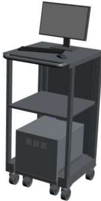
3.att. Loģistikas ratiņu 3D modelis [autoru veidots]

akumulators, inverteris, dators, LED ekrāns, barkoda skeneris, uzlīmju printeris, Wi-Fi adapteris, akumulatora lādētājs, datorpele, klaviatūra un savienotājvadi.