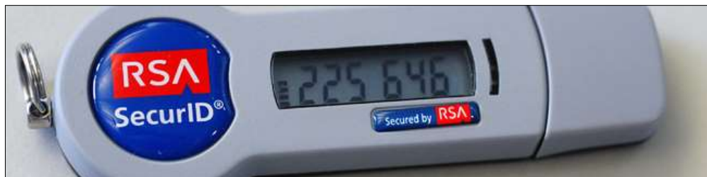
2.attēls. Vienreizējo parolu ģenerēšanas iekārtas piemērs.

Trešais piemērs balstās uz sinhronizācijas un vienotas datubāzes ar parolēm, kuras tiek izmantotas sistēmas piekļuvei, kur katra parole ir vienreizēja. Pateicoties tam ja uzbrucējs iegūst lietotāja izmantoto paroli, tā jau nebūs derīga turpmākām darbībām.