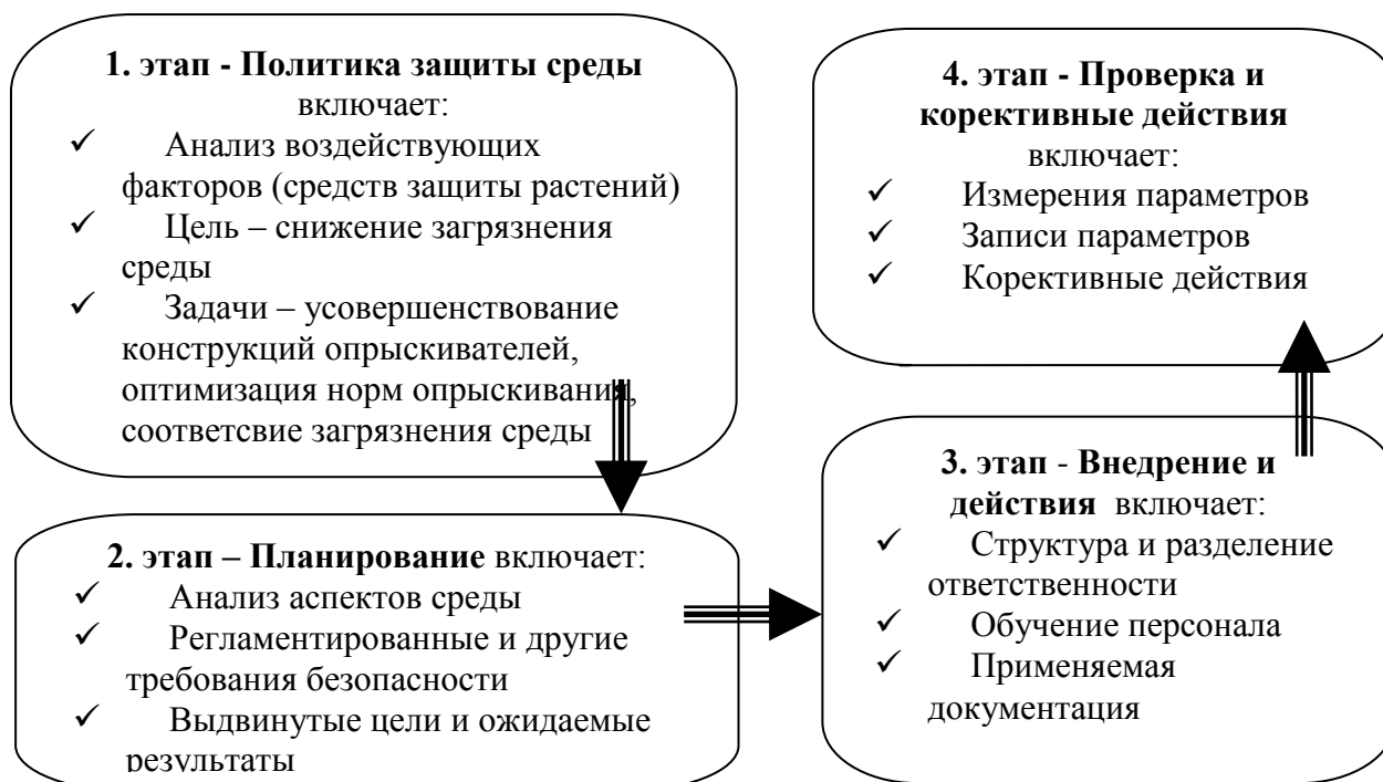
Рис. 1. Модель системы управления защиты среды при использовании полевых опрыскивателей.

Политика защиты среды должна обеспечивать соблюдение законодательства и непрерывное снижение загрязнения окружающей среды. Нами предлагаемая модель системы управления защиты среды при использовании полевых опрыскивателей приведена на рис.1. Система разработана в соответствии с требованиями стандартов серии ISO 14001.