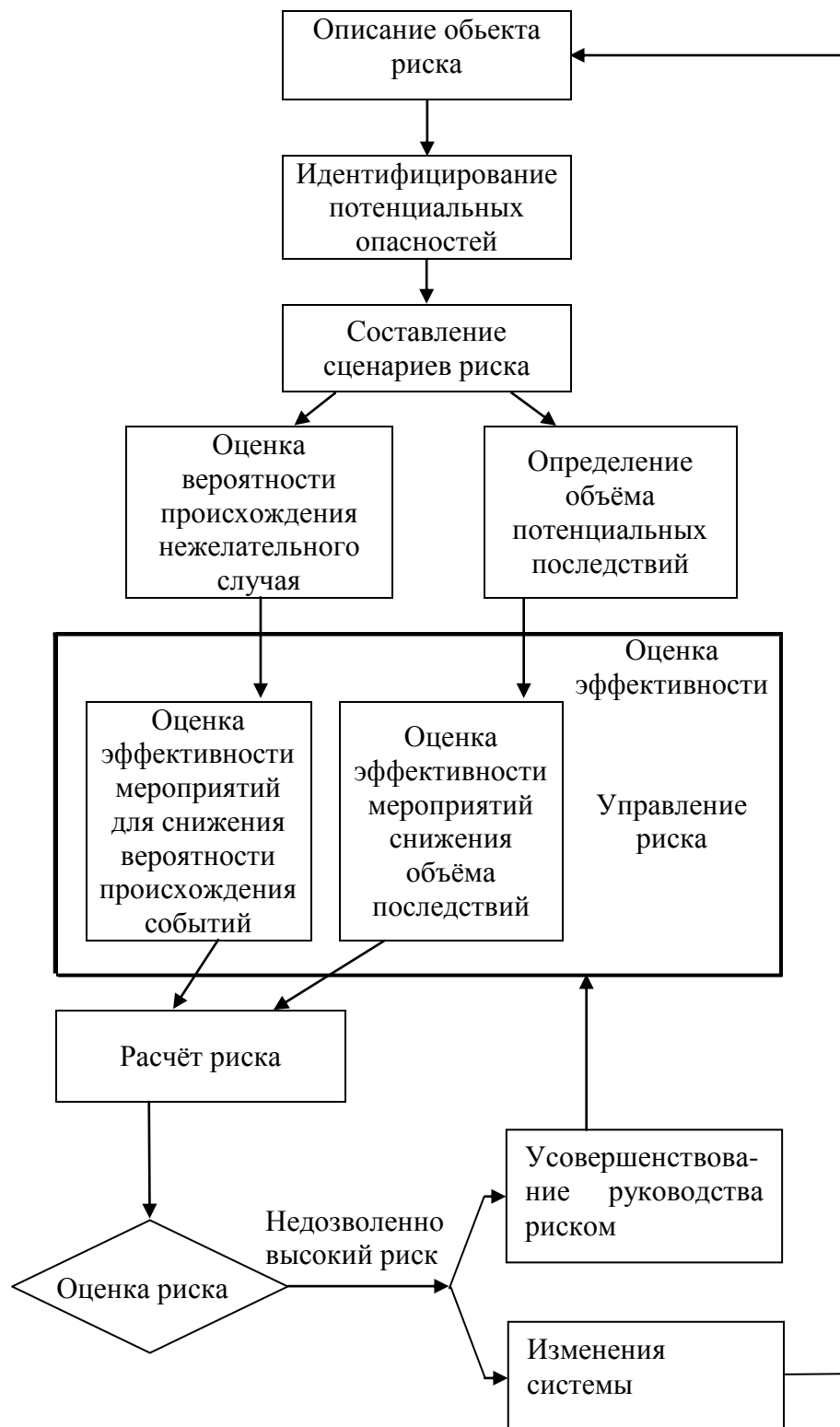
Рис. 2. Процедура оценки риска полевых опрыскивателей.