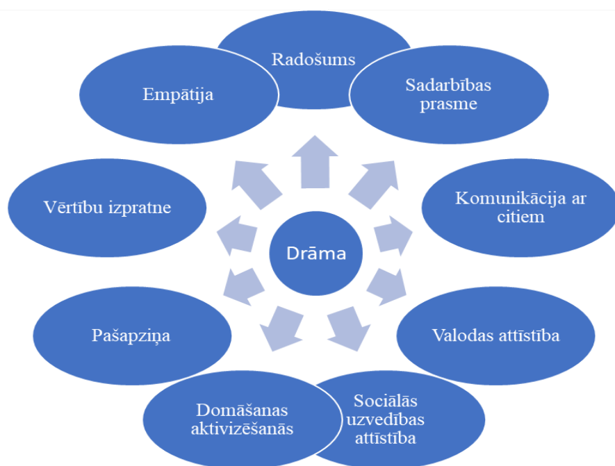
3.attēls. Drāma kā metode bērna personības attīstībai