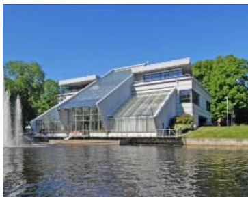
3. attēls. Rīga. Administratīvā ēka Kronvalda bulvārī 1. 2000. M. Malahovskis (Krastiņš, 2013).

Dekonstruktīvisms pazīstams pēc arhitektu paveiktajiem darbiem un nav izplatīta parādība. Arī Latvijas arhitektūrā ir tikai nedaudz piemēru šajā ievirzē, kas visbiežāk ir konstrukcijas, kur celtnes pamatapjomi savērsti vai sagāzti atsevišķi būvapjomu daļas. Kā vienu no piemēriem var pieminēt Rīgas brīvostas pārvaldes administratīvajai ēkai Kronvalda bulvārī 1 (skat. 3. att.). Kā par šo projektu izsakās pats arhitekts: „projekts sola dziļu personisku pārdzīvojumu” (Krastiņš, 2013).