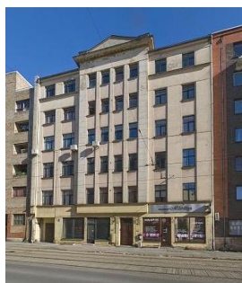
5. attēls. Rīga, Miera ielas 82 ēka, SIA „Darba aizsardzības administrācija”. ( http://www.myrealestate.lv/property/3-istabu-dzivoklis-miera-iela-82-riga/ ).

Ēkas ekspluatācija tika uzsākta 1931. gadā, līdz ar to ēkas arhitektūras stils attiecināms uz starpkaru perioda historisma un Art Deco stila aizsākumu (skat. 2. tabulu), un iepriekšminētie arhitektūras stili, ekonomiskās situācijas dēļ, nomainīja populāro Jūgendstilu.