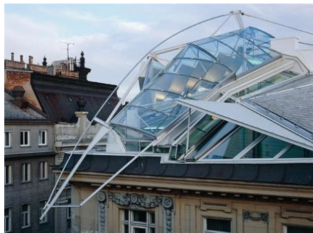
4. attēls. Coop Himmelb(l)au Jumta pārbūve. ( https://www.pinterest.com/1ww6b5ojw0g2l4y/parasite-arq/ ).