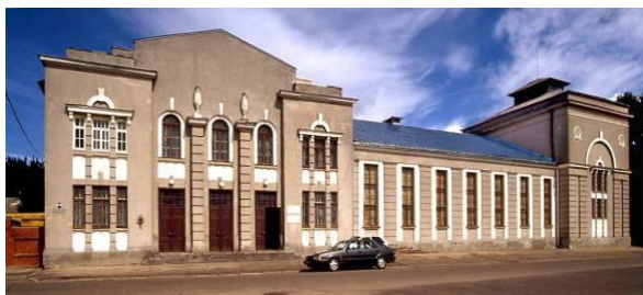
6. attēls. Rēzekne. Tautas nams. 1928. P. Pavlovs (Krastiņš, 2013).

Dažādā veidā interpretēti Art Deco formālie elementi vai vienkārši Art Deco estētikai atbilstošā izpildījumā kārtotas stilizētas detaļas, kas ņemtas no klasisko formu arsenāla (Krastiņš, 2013), un kā piemēru, var minēt Rēzeknes tautas namu , kas nodots ekspluatācijā 1928. gadā, un ēkas arhitekts ir Pāvils Pavlovs. Aplūkojot 6. attēlu, var redzēt vizuālu līdzību ar Rīgā, Miera ielā 82 esošo dzīvojamo un biroja vajadzībām izmantojamo ēku.