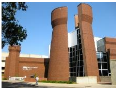
1. attēls. Wexner Center for the Arts Columbus. ( http://www.house-design-coffee.com/postmodern-architecture.html ).

Konstruktīvisma kustībai Krievijā var saskatīt līdzību ar dekonstruktīvisma stila arhitektūru, kā, piemēram, arhitektu Vladimira Tatlina (1885-1953), Ļubova Popova (1889-1924) un El Lissitzky (1890-1941) izstrādātajos projektos.