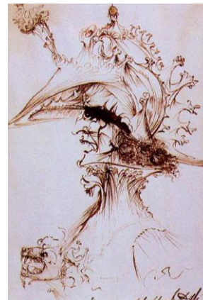
17. attēls. Salvadors Dalī. Kondotjera (pašportrets kondotjera veidolā). 1943, tuša.

Vērojot S. Dalī darbus, tieši zīmējumus ar tušu, var novērot, ka bieži vien tā netika izmantota viena, bet gan sajaukta, kā tika minēts iepriekš, ar citām māksliniecišķām tehnikām, piemēram, ar akvareli, guašu, zīmuli utt. Protams, Dalī zīmējumos var sastapt arī tīri tušas tehnikā izpildītus darbus, piemēram, Kondotjera (pašportrets kondotjera veidolā) (skat. 17. att.), kurš savukārt izskatās pēc nedaudz irreāla tēla, kaut gan izpildījuma ziņā uzmanību piesaista sīks detaļu izpildījums.