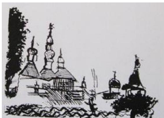
14. attēls. Marks Šagāls. Vitebska. 1908, tuša, spalva (Де Поза, 1998: 44).