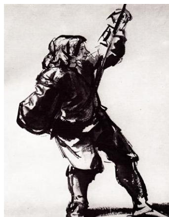
2. attēls. Rembrants van Reins. Jauneklis, kas stiepj virvi . 1665, tuša, ota (Королёв, 1984: 65).

Ne mazāk nozīmīgs darbarīks tušas zīmējumu tehnikā ir ota. Ar to var veikt gan tušas mazgājumus, gan strādāt sausās otas tehnikā, gan brīvos lineāros zīmējumos.