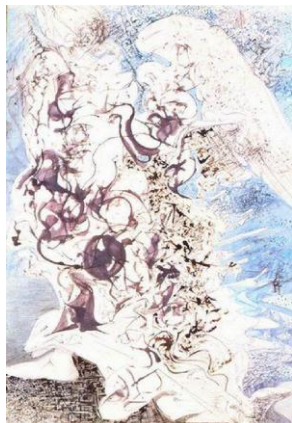
15. attēls. Salvadors Dalī. Zigmunda Freida portrets . 1938, pelēks papīrs, tuša, guaša ( http://sdali.ru/view.php?menu=k3439&k=k0227.jpg ).

bieži vienkāršu zīmējumu, skiču izpildījums neierobežojas tikai vienas tehnikas ietvaros, tādejādi tie liekas aizvien interesantāki. Piemēram, Zigmunda Freida portrets (skat. 15. att.), kas ir izpildīts ļoti pirmkārt reālistiski, otrkārt, darbs tika izpildīts gan ar tušu, gan guašu, ņemot par pamatu (papīru) pelēko krāsu. Vai arī cits līdzīgā tehnikā izveidots darbs Enģelis (skat. 16. att.), kas savukārt ir izpildīts daudz ekspresīvākā manierē, nav nolasāms tik skaidrs tēls, arī detaļu, līniju dažādība, kuras kopā izskatās vienotas, piesaista uzmanību darbam. Salīdzinot ar iepriekš minēto darbu, kurš arī tika veikts tādā pašā tehnikā, šajā darbā daudz vairāk tiek izmantota krāsa un sīkas detaļas.