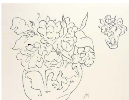
9. attēls. Anrī Matiss. Divas vāzes ar ziediem. 1938, tuša, spalva ( http://www.staratel.com ).