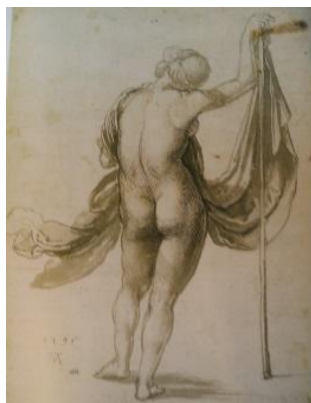
6. attēls. Albrehts Dīrers. Sievietes akts no mugurpuses. 1495, tuša, ota (Eihlere, 2008: 72-73).