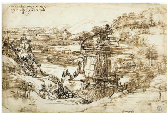
4. attēls. Leonardo da Vinči. Arno upes ainava . 1473, zīmulis, tuša ( http://www.abc-people.com ).

Kā vēl vienu spilgtu piemēru var minēt izcila Renesanses laikmeta vācu gleznotāja, grafiķa Albrehta Dīrera darbus, kurus tas veicis tušas tehnikā, izmantojot gan spalvu darbā Nirbendziete un venēciete (skat. 5. att.), gan otu – Sievietes akts no mugurpuses (skat. 6. att.), gan kombinējot tušu ar citiem materiāliem, piemēram, darbs Ādams un Ieva (skat. 7. att.) (spalvas zīmējums apvienots ar akvareli), vai arī izmantojot tonētu papīru.