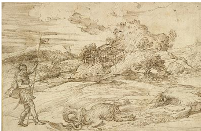
1. attēls. Ticiāns Večellio. Aina ar Sv. Teodoru, kurš uzvarējis pūķi. 16. gs. vidus, spalva, brūnā tuša.

Ieplānotais rezultāts (nepieciešamās formas un tonis) tiek sasniegts ar dažādu līniju un štriha palīdzību. Kā piemēru varētu minēt Ticiāna darbu Aina ar Sv. Teodoru, kurš uzvarējis pūķi (skat. 1. att.), kurā attēlota leģenda par Sv. Teodora uzvaru pār pūķi. Darbs izpildīts, izmantojot spalvu, brūno tušu un melno ogli. Darbs ir izpildīts brīvi, ar vieglām štriha līnijām.