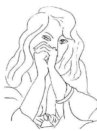
10. attēls. Anrī Matiss. Sievietes portrets. 1944, tuša, spalva.

Pablo Pikaso – spāņu gleznotājs, keramiķis, grafiķis, tēlnieks un dizainers ( Pablo Pikaso http://nekropole.info/lv ), kura talants tika pamanīts vēl viņa bērnu dienās.