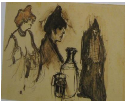
11. attēls. Pablo Pikaso. Studijas. 1901, krāsains spalvas zīmējums (Buholca, Cimmermane, 2006: 15).

Taču uzmanību piesaista viens no vēlīnā perioda darbiem – Pikadors ar meiteni (skat. 13. att.) otas zīmējums. Pēc būtības ir ātrs un viegls uzmetums ar otu, melnbaltajos toņos, kurā ar dažiem otas mājieniem tiek parādītas cilvēku figūras ar raksturīgām kustībām, ģērbšanas stilu, tā, ka ir nolasāms attēloto personu raksturs.