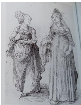
5. attēls. Albrehts Dīrers. Nirbendziete un venēciete. 1495, tuša, spalva (Лубман, 1972: 380).

mākslinieka daiļrades sākumposmam, savukārt pārējie darbi atbilst laikam, kad A. Matiss vairāk pievērsās zīmēšanai, kaut gan izpildījuma raksturs jau iezīmējas agrākajos darbos. Darbos ir pasvītrots raksturīgākais, atmetot visu lieko – zīmējamo objektu noskaņojums, acu skats, matu sakārtojums (parādīts burtiski ar divām trijām līnijām). Tāpat, gan zīmējumā ar otu, gan spalvu līnijas ir vilktas ļoti pārliecinoši, ievērojot arī zīmēšanas noteikumus, proporcijas, perspektīvas likumus utml.