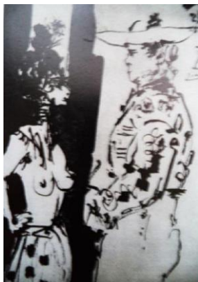
12. attēls. Pablo Pikaso. Zīmējums kafējnīcas Els 4 gats ēdienkartei. 1899, tuša, guaša (Buholca, Cimmermane, 2006: 14).