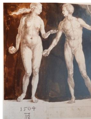
7. attēls. Albrehts Dīrers. Ādams un Ieva. 1504, tuša, spalva, akvarelis (Eihlere, 2008: 67)