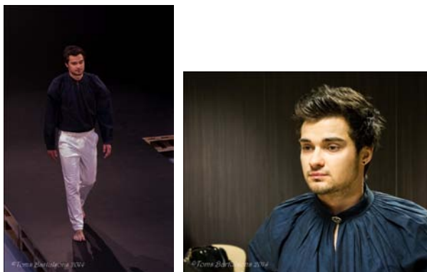
5. attēls. Piebalgas krekls mūsdienu versijā.

Lai konstrukciju padarītu mūsdienīgāku, piedurknēm padušu ķīlis tika saglabāts, bet platums, virzienā uz dūrgalu, tika sašaurināts, atbilstoši klasisko vīriešu kreklu konstrukcijām. Piebalgas krekls ar stāvā iešūtiem uzplečiem izstrādāts mūsdienu versijā (skat. 5. att.), kur ir mainīts ne tikai piedurkņu platums, bet arī stāva platums ir samazināts, kā arī balansa koriģēšanas dēļ, pievienotas divas papildus griezumlīnijas.