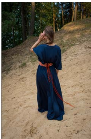
2. attēls. Antīkās konstrukcijas tērps.

Lai pētītu etnogrāfiskā piegriezuma tērpus, pavasara / vasaras tērpu kolekcijā „Labs nāk ar gaidīšanu”, kas tika demonstrēta modes skatē “Ķīpsalas pavasaris’14”, tika iekļauti apģērbi, kuru konstrukcijas tika veidotas, par pamatu ņemot etnogrāfisko tērpu konstrukcijas.