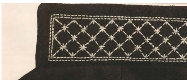
6. attēls. Alsungas vīriešu svārku apkakle. (Grasmane, 2000)

Lai etnogrāfiskas konstrukcijas tērps izceltos starp pārējiem produktiem, kuriem bieži vien ir līdzīgas konstrukcijas, tas jāpapildina ar citiem etnogrāfijas elementiem. Piemēram, žakete (skat. 4. att.) ir papildināta ar izšuvumiem uz apkakles un kabatu detaļām, iedvesmojoties no Alsungas vīriešu svārku izšuvumiem (skat. 6. att.). Izšuvumi veidoti ar metāla diegiem zelta krāsā, kas pieskaņoti misiņa āķiem, kas veidoti kā kopijas no Ventspils vīriešu tautas tērpa.