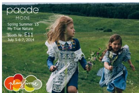
1. attēls. Paade Mode kolekcija. ( http://www.paade.lv )

saskatāmi dekorācijās un krāsās, jo šī patērētāju grupa nevēlas sarežģītus piegriezumus, kas varētu apgrūtināt aktīvu darbošanos. Tātad, veidojot etnogrāfisko apģērbu, vienmēr jādomā par patērētāja komfortu, un tikai tad par konstrukciju sarežģītību.