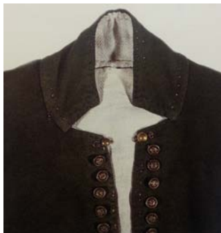
3. attēls. Ventspils aprīņa jaka. (Rozenberga, 1995)

Iedvesmojoties no Ventspils aprīņa 19. gs vidus jakas (skat. 3. att.), kas darināta no vilnas tūka auduma ar linu oderi (Rozenberga, 1995), ir izveidota mūsdienīga vīriešu žaketes versija (skat. 4. att.). Apkakle konstruēta kā kopgriezta stāvapakle, ar trīsstūrveida iegriezumiem galos. Žaketes griezumlinijas sastopamas tautas tērpos, bet atbilstoši modes tendencēm, un sezonai, kam kolekcija paredzēta, žaketes piedurknes ir saīsinātas.