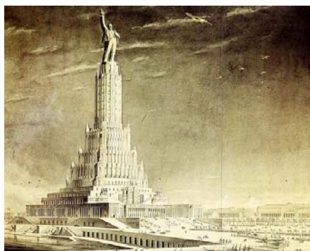
1. attēls. Padomju tautas pils.

( http://spoki.tvnet.lv/vesture/Dullakie-projekti-Krievijas/266148/1/2 )