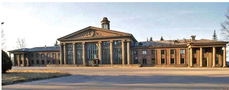
5. attēls. Rīga, Lidosta „Spilve” Spilves ielā 1, 1954. Arhitekts: S. Vorobjovs. ( http://e.znet.lv/Arhitekt_stili_Latvija_Text.pdf )

Lidosta „Spilve” (skat. 5. att.). Viens no sociālistiskā reālisma tīrradņiem ir lidosta „Spilve” Rīgā, Spilves ielā 1 (1954, projektu izstrādājis Maskavas arhitekts Sergejs Vorobjovs). Ēkas simetriskajā un piezemētajā apjomā apspēlētie antīko tempļu arhitektūras motīvi izkārtoti līdzsvarotā kompozīcijā. Greznajā iekštelpu apdarē ir saglabājušies arī monumentāli sienu gleznojumi. Uzpēlēti naivā nopietnībā tajos risinātas „mierīgā darba”, „tautu draudzības” un citas līdzīgas tēmas. Gleznojumos attēlotas ļaužu grupas, kuras komunisma jauncelsmes patosā apgarotām sejām droši raugās nezināmā tālumā absolūtajā laimīgajā nākotnē (Krastiņš, b.g.).