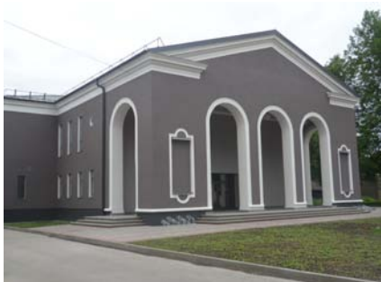
8. attēls. Rēzekne, kādreizējais kinoteātris "Zvaigzne", šodien – Kultūras un izglītības centrs.

vienlīdz spilgti izpaužas arī Padomju Latvijas Sociālistiskās Republikas arhitektūrā. Vairākums pētnieku arhitektūras vēsturē terminu „Staļina arhitektūra” hronoloģiski iedala no 20. gadsimta 30. gadu vidus līdz 50. gadu vidum. Savukārt pētījuma autore izvēlējusies laika posmu no 20. gadsimta 50. līdz 60. gadiem, jo turpmākā pētījuma izvēlētais objekts ir Kultūras un izglītības centrs Rēzeknē (bijušais kinoteātris „Zvaigzne”), kas nodots ekspluatācijā tikai 1957. gadā un kas ir izcils tā laika sociālistiskā reālisma paraugs Latvijas arhitektūrā (skat. 8. att.).