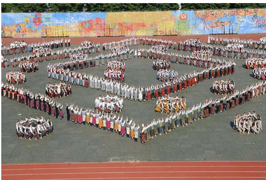
2.attēls. X Skolu jaunatnes deju svētki „Deja kāpa debesīs”.

Tomēr galvenais ieguvums ir tajā, ka skolēnu Deju svētki nodrošina tradīcijas pārmantojamību visās paudzēs, vairo sabiedrības interesi par tradicionālo kultūru un globalizācijas apstākļos saglabā nelielas tautas nacionālo savdabību.