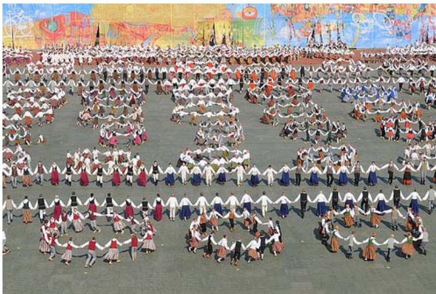
3.attēls. X Skolu jaunatnes deju svētki „Deja kāpa debesīs”.