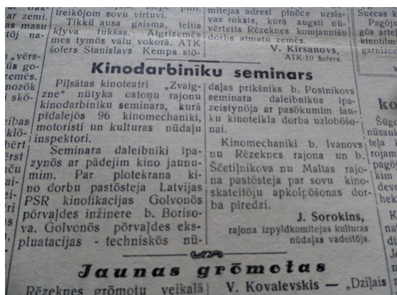
7. attēls. Raksts „Kinodarbiniku seminars” par semināra norisi kinoteātrī „Zvaigzne”. Pa Staļina ceļu. N. 118 (1439) 4. oktobris 1956. g. Inv.nr. 15027. Latgales Kultūrvēstures muzeja krājums.

Seansi galvenokārt sākās plkst. 15:00, 17:00, 19:00, 21:00. Izņēmuma kārtā kāds seanss varēja sākties arī 12:00 (droši vien tas notika svētdienās), savukārt kāds cits seanss varēja sākties ļoti vēlu plkst. 21:40 (Kino reklāmas afišas vietējā laikrakstā “Pa Staļina ceļu”, 1956).