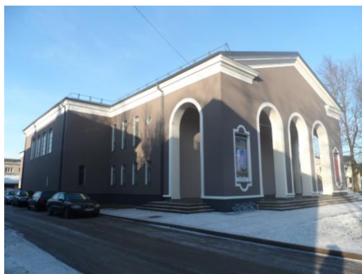
6. attēls. Bijušais kinoteātris „Zvaigzne”. Rēzekne. Atbrīvošanas alejā 97. Skats no Latgales Kultūrvēstures muzeja puses.

Kinoteātris „Zvaigzne” uzbūvēts uz paaugstinājuma, līdz kuram ved četru pakāpienu rinda. Apmeklētāji kinoteātrī var ieiet pa trim ejām – no priekšpuses un sānu ejām. Pirms ieejas durvīm ir izbūvēts izmēros apjomīgs, diezgan butaforisks (kā autorei šķiet) portiks bez īpašas pielietojuma funkcijas un to ieskauj masīvu arku loki. Ēkas frontonā vērojams apakšējās malas simetrisks karnīzes norāvums, kas bija raksturīgs ampīra arhitektūras stilam. Karnīzes dekoratīvajā joslā apskatāmi vijīgi, stilizēti augu motīvi. Ēkas sētas pusē ir redzama arkas butaforija un neliels, apaļš, visdrīzāk, dekoratīvs logs. Dekoratīvie apaļie lodziņi vērojami pa visu ēkas perimetru. Pagalma pusē frontona karnīze nav pārrauta. Karnīzes vienlaidu mala bija raksturīga klasicismam. Ēkas ieejas abās pusēs paredzētas vietas afišām. No ārpuses ēka nav sevišķi grezna, kas nav raksturīgi citām Staļina laika būvēm; tā ir bez liekām dekorācijām, bet pietiekoši monumentāla, reprezentatīva un cēla (Apele, 2016) (skat. 6. att.).